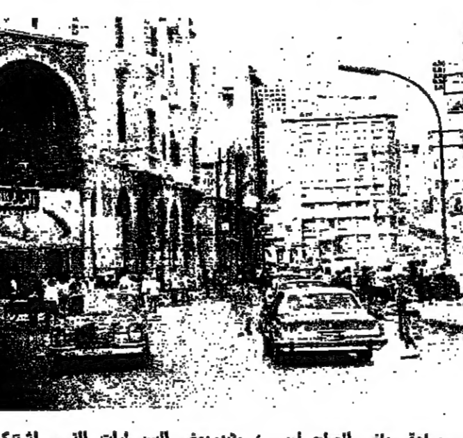
مواطنون غابروا ونزلوا الساحة رياض الصلح امس ، وتبدو بعض السيارات التي اشتركت بالمعركة

كثبت تقويم حاتم : بيروت الكتيبة عاشت امس ، ويوما اخر من الصمت والوحشة والحسزن والقلق. الذين تجولوا في شوارعها ، على قلمهم وشعرها برهبة الخوف وبشاعة الموت ، كل شيء هادئ اذا استتبنا اصوات الرصاص المتبادل احيانا بين سطح وسطح ، وبينية وبينية ، وكثرة يخشى ورهبة عاصمة جديدة ، الميون تتجول في كل اتجاه ، بعضهم كانوا اصحابي محاور نحووا مسلح الموت ليتنقوا موازي زرقهم التي لم تظلم ايدي المصومين حتى الآن ، وبصمهم ذهبوا لشراء حاجياتهم الضرورية فطلب منهم ان يجل من بيوتهم لهم ، الكتاب والقطب وحدها كانت تتجمر قرب امكن التفتيات المراكمة في زوايا الشوارع والساحات.